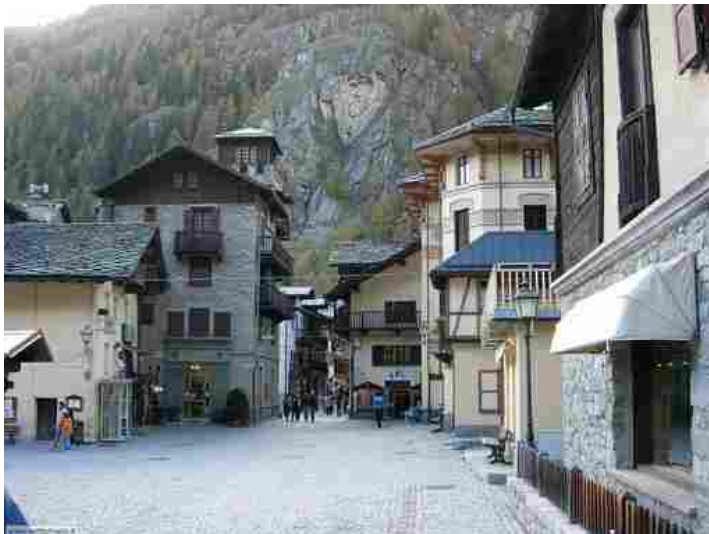
Gressoney Saint-Jean sarà 'presa d'assedio' dai giornalisti tv dal 14 al 16 settembre

Nato come laboratorio di innovazione, dibattito e approfondimento sui linguaggi del giornalismo contemporaneo, si svolge dal 14 al 16 settembre, a Gressoney Saint- Jean, il Premio Subito 2018 dal titolo 'Visto si stampi. Perché guardare is the new leggere'. Giunto alla sesta edizione, è organizzato con il sostegno e il contributo della Presidenza della Giunta e del Comune di Gressoney Saint-Jean.